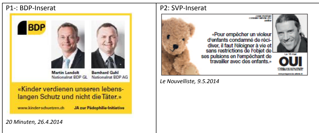
Abbildung 3.1: Illustrative Beispiele der wichtigsten Inseratetypen des Pro-Lagers

Was die Contra-Seite anbetrifft, wurden die Inserate von Parteien aufgegeben. Es handelte sich um die CVP Oberwallis, die SP Appenzell Innerrhoden und um die Gruppe für Innerrhoden (GFI).